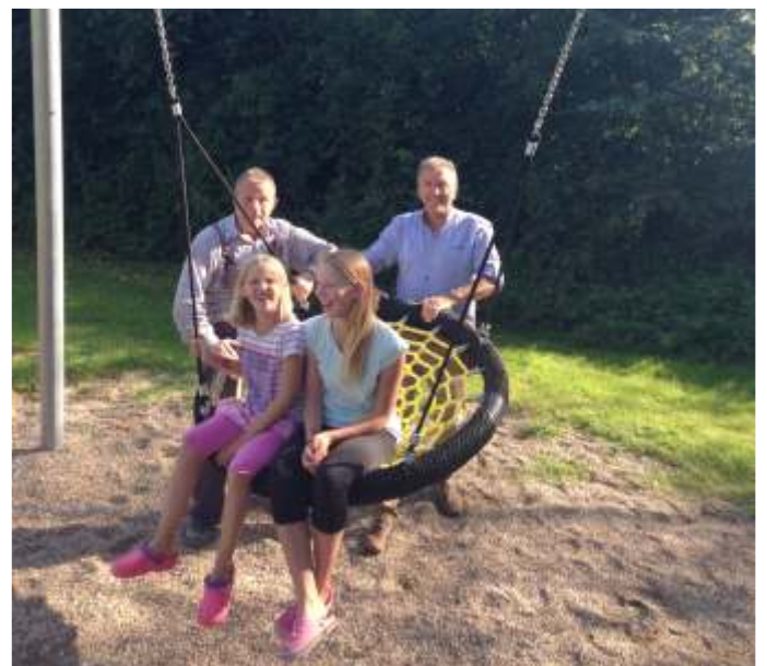
Nestschaukel Stampe 2015