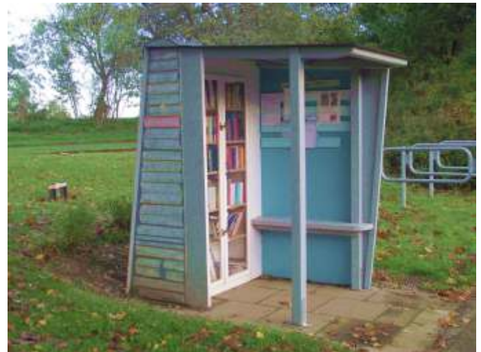
Bücherschrank in Stampe 2017