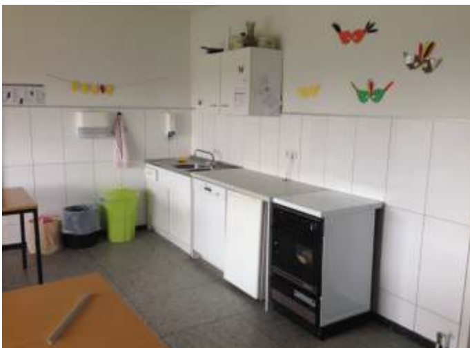
Fliesenarbeiten Küche KiTa 2016