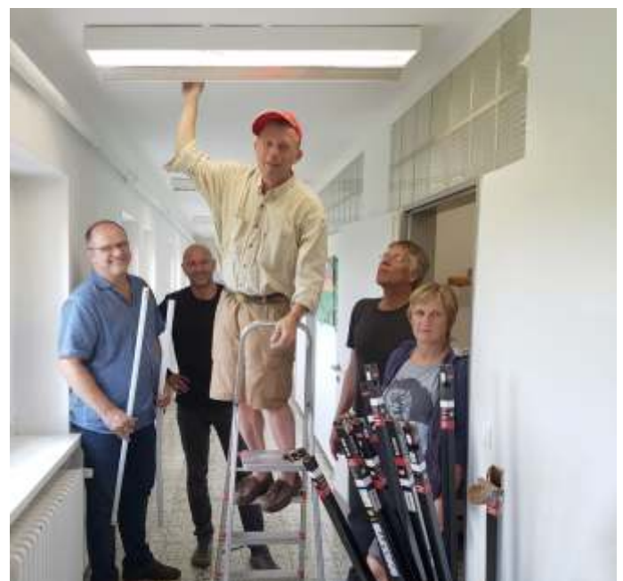
LED-Umrüstung Schule 2017