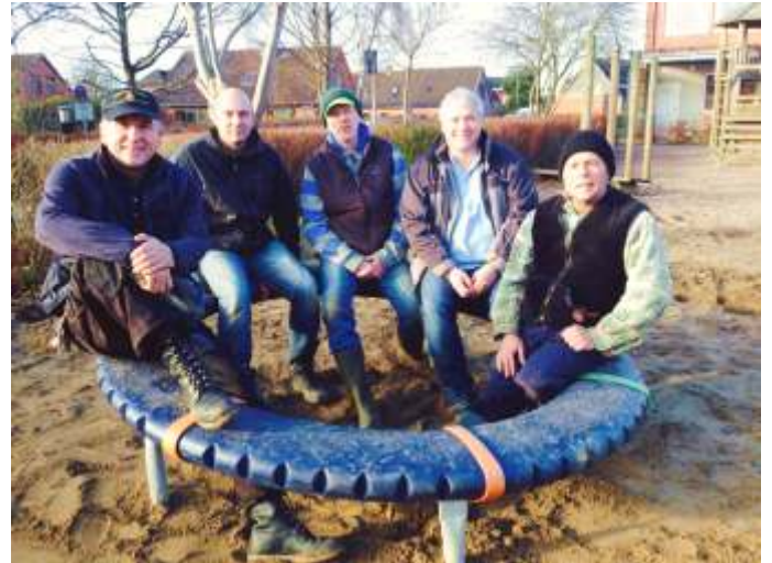
Umbau Supernova 2014