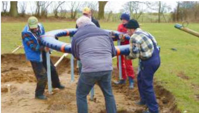
Aufbau Supernova 2013