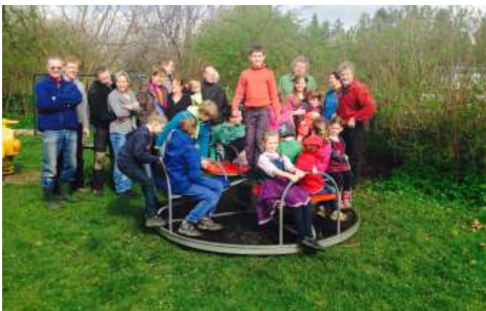
Spielplatz Flemhude 2014