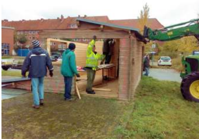
Abbau Holzhaus Wellingdorf 2016