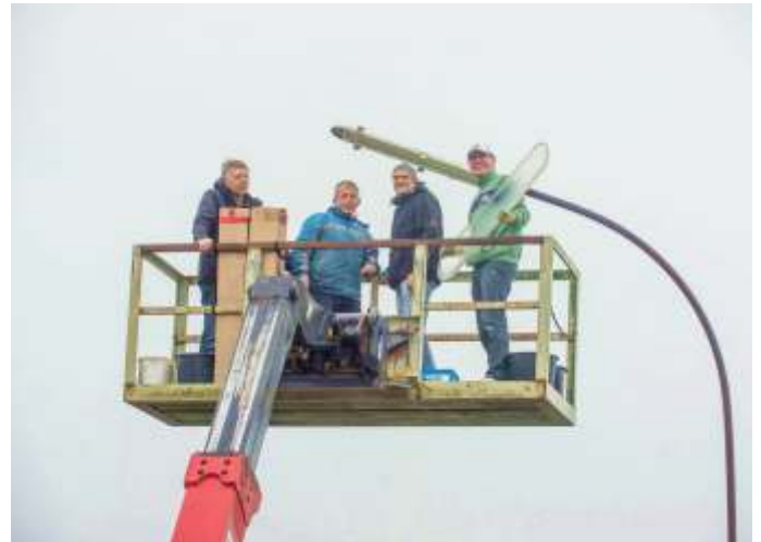
LED-Umrüstung Straßen 2017